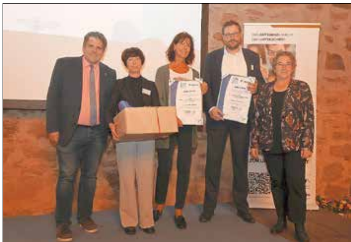
Sieger SKMB und Hörstudio

Arbeitgeber, die sich besonders für kulturelle Vielfalt in der Region einsetzen, können mit dem Gütesiegel ausgezeichnet werden, sodass ihr Engagement noch zusätzlich nach außen strahlt. Die jeweils besten Leistungen in den beiden Kategorien große beziehungsweise mittlere Organisationen und kleine Organisationen haben Stadt und Kreis zudem mit einem Preis geehrt. So erhielten die Sparkasse Marburg-Biedenkopf und das Hörstudio Suffert in Marburg ein Insektenhotel mit Samenröhren für ihren besonderen Einsatz rund um interkulturelle Vielfalt in ihren Unternehmen.