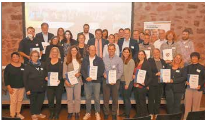
Gruppenfoto