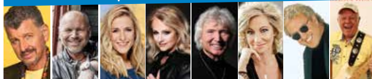
Semino Rossi, Olaf Henning, Stefanie Hertel, Nicole, Peter Orloff, Claudia Jung, Bernie Paul und Graham Bonney

Weitere Infos unter: www.schlager-kanaren.de