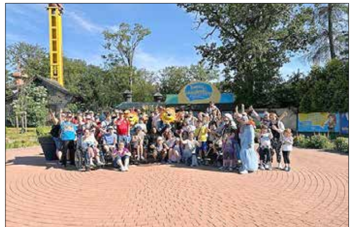
Die Kinder und ihre Angehörigen nach Ihrem Ausflug vor dem Taunuswunderland

Der Verein Stützende Hände e.V. setzt sich seit 2013 leidenschaftlich für die Unterstützung von hilfsbedürftigen Menschen in der Stadt und Region ein. Herzstück ist die ehrenamtliche Verteilung von über 1.200 warmen Mahlzeiten pro Woche an Obdachlose in der Frankfurter Innenstadt. Darüber hinaus wird jedes Jahr zu Weihnachten eine Geschenkeaktion an sozial benachteiligte und schwerkranke Kinder ausgerichtet. Über 600 Ehrenamtliche sind im Verein aktiv. Anfang September 2024 ist die Eröffnung des neuen Kinder- und Jugendzentrums „Zentrum 069“ auf etwa 1.200 Quadratmetern Fläche im Vereinshaus der Stützenden Hände e.V. (Mainzer Landstraße 229) geplant, mit zahlreichen Angeboten für gemeinsame Aktivitäten, darunter eine 300 Quadratmeter große Sportfläche, ein Tonstudio und ein Kunstraum sowie kostenfreies Mittagessen und Hausaufgabenbetreuung. Neue Vereins-Standorte werden in Düsseldorf, Essen und Heidelberg angestrebt. Dafür werden händeringend weitere Ehrenamtliche gesucht. Weitere Informationen unter: https://stuetzende-haende.de/