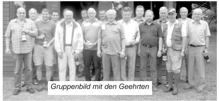
Gruppenbild mit den Geehrten