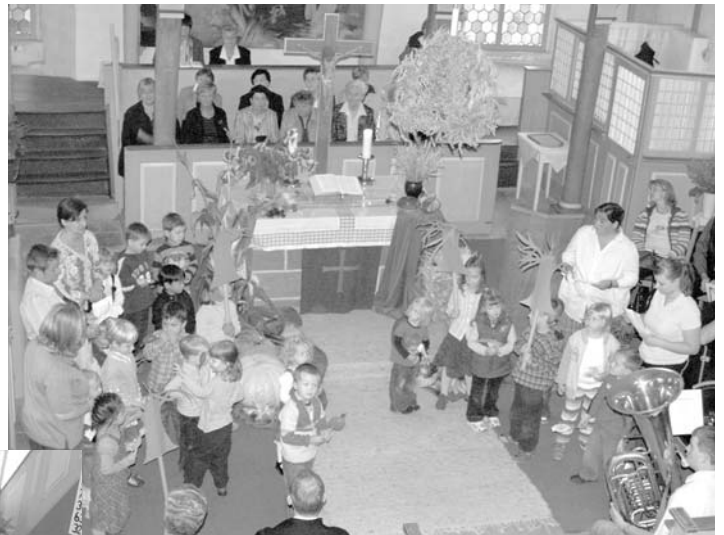
ergänzt. Die Nachwuchsmusiker der Musikschule Fröhlich rundeten das Programm mit ihren Musikstücken ab.

Nachmittags wurde das reichhaltige Angebot noch um Kaffee und (Kartoffel-)Kuchen