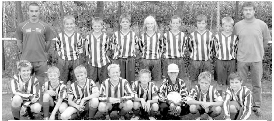
D-Jugend der JSG Gemünden/Wohratal