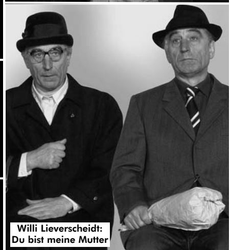
Zufälliger Tod eines Anarchisten Regie: Matze Schmidt