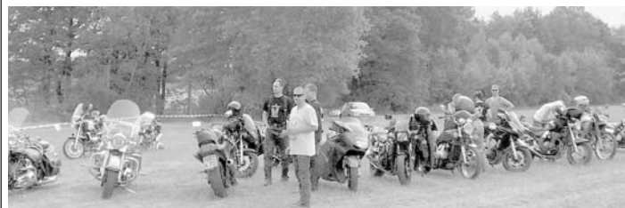
Viele Biker fanden am 22.07.2006 den Weg nach Hertingshausen

Abends wurden die Sieger in den Sparten "größte Teilnehmergruppe" und "bester Sound" ermittelt. Die Gewinner konnten sich über tolle Preise