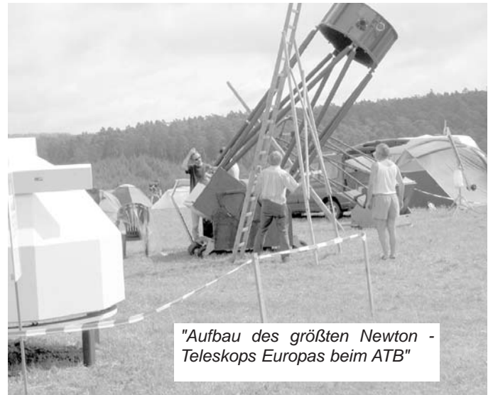
"Aufbau des größten Newton - Teleskops Europas beim ATB"

Wenn am Abend die Sonne untergeht, beginnt die schönste Zeit für die zum 4. Mal in Hertingshausen versammelten Amateur- Astronomen und alle Astronomie-Interessierten. Endlich kommt die Dunkelheit und mit ihr tauchen am Himmel die für uns alle sichtbaren Sternbilder und der Planet Jupiter auf. Mit den ca. 200 mitgebrachten verschiedenen Teleskopen kann man aber weit mehr sehen: die Wolkenbänder und Monde des Jupiters, plane-