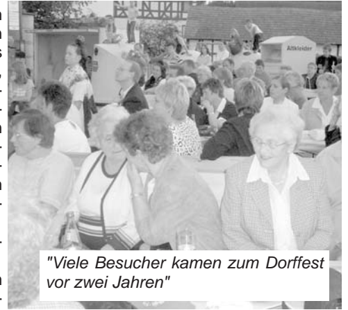
"Viele Besucher kamen zum Dorffest vor zwei Jahren"

Als Nachfolgeveranstaltung für die Halsdorfer Dorfabende hat der Männergesangsverein im Jahr 2005 ein Dorffest ins Leben gerufen, das von der Bevölkerung gut angenommen wurde. Aus diesem Grund wollen wir in diesem Jahr die Veranstaltung am Samstag, 25. August 2007 im und beim Treffpunkt Halsdorf wiederholen. Beginnen wollen wir um 18:00 Uhr. Um 19:00 Uhr ist ein kurzes Programm geplant, das von der Volkstanz- und Trachtengruppe, dem Posaunenchor, dem Gospelchor, dem Landfrauenverein und dem Gesangsverein gestaltet wird. Im Anschluss soll in gemütlicher Runde gefeiert werden. Mit dieser Veranstaltung soll die Dorfgemeinschaft gefördert und das gesellige Zusammenleben im Ortsteil Halsdorf bereichert werden.