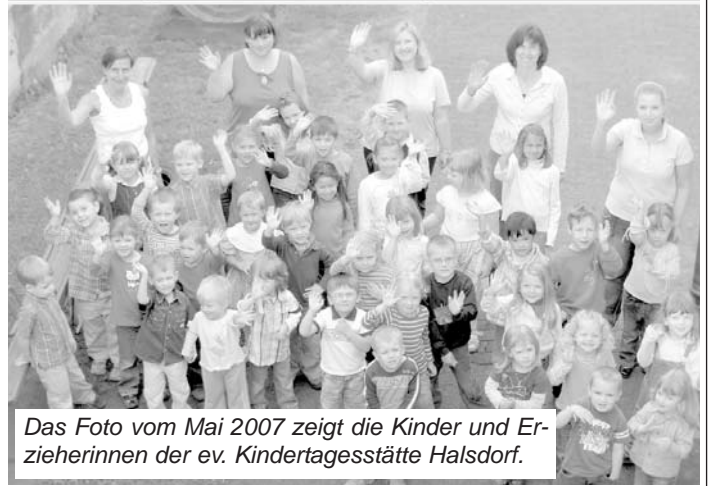
Das Foto vom Mai 2007 zeigt die Kinder und Erzieherinnen der ev. Kindertagesstätte Halsdorf.

den Landkreis Marburg-Biedenkopf, das Land Hessen und die Evangelische Kirche von Kurhessen-Waldeck bereitgestellt. Nicht zu vergessen die aktiven Helfer, die viele freiwillige Arbeitsstunden abgeleistet haben.