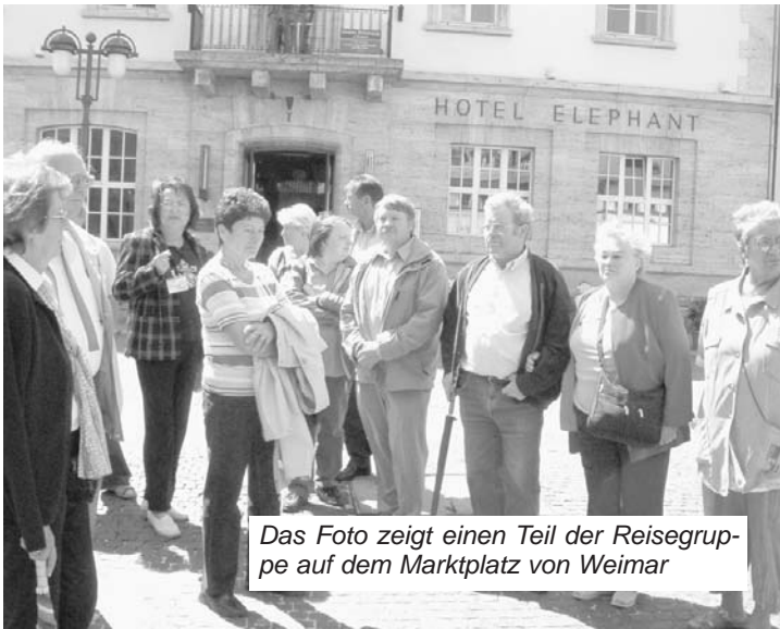
Das Foto zeigt einen Teil der Reisegruppe auf dem Marktplatz von Weimar