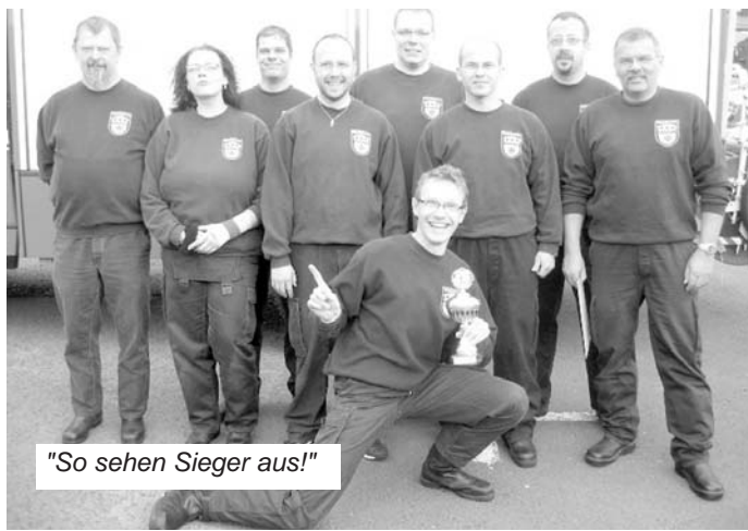
"So sehen Sieger aus!"

Herzlichen Glückwunsch für diese herausragende Leistung und viel Erfolg bei der Teilnahme am Landesentscheid.