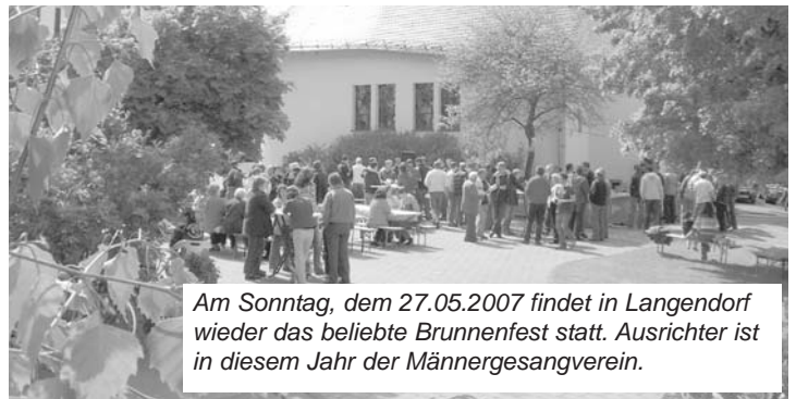
Am Sonntag, dem 27.05.2007 findet in Langendorf wieder das beliebte Brunnenfest statt. Ausrichter ist in diesem Jahr der Männergesangverein.

Langendorf: 10.30, Brunnenfest, MGW Langendorf, Langendorf