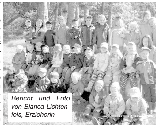
Bericht und Foto von Bianca Lichtenfels, Erzieherin

Dies blieb den Kindern nicht lange verwehrt. So sahen sie einen Feldhasen, einen Specht, ein Eichhörnchen, Rehe und viele kleine Krabbeltiere. Aus umgefallenen Bäumen wurden Höhlen oder Balanciermöglichkeiten. Es wurden gemeinsam mit den Erzieherinnen Tippis gebaut und ein Waldsofa aus Ästen diente als Sitz- und Ruhegelegenheit für die Kinder. Ebenso konnten die Kinder in einem Teil des Waldes, Fuchsbauten besichtigen. Die Vorschulkinder sammelten Blätter und Pflanzen zur Anlegung eines Herbariums das in Nachbereitung in der KiTa fertig gestellt werden soll. Abwechslungsreich und intensiv setzten sich die Kinder mit dem Wald und seinen Lebewesen auseinander. So lernte man das Umfeld kennen und schätzen. Blätter wurden nicht wahrlos von den Bäumen gerissen und die Krabbeltiere am Leben gelassen. Auch dem Wetter sollte nicht getrotzt werden. So ging man auch im Regen, ließ aber den Eltern und Kindern die Wahl des Mitlaufens indem eine Gruppe in den Räumen der Kita betreut wurde. Am Ende des Waldprojektes, zogen die Kinder und Erzieherinnen ihr Resümee im nächsten Jahr wieder ein Waldprojekt durchzuführen.