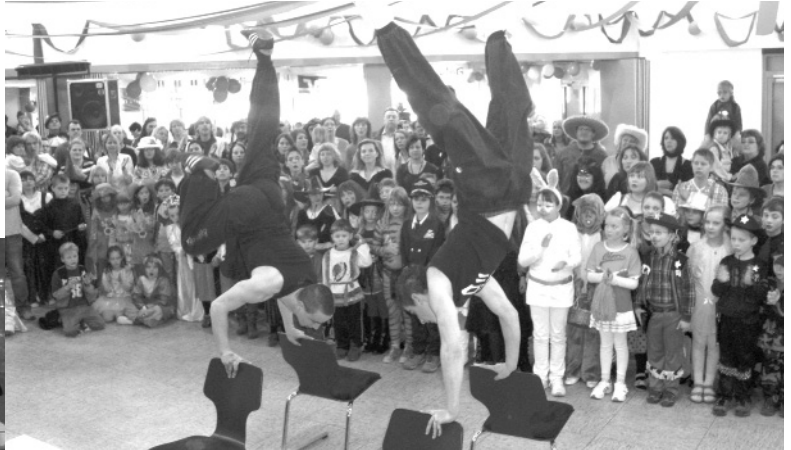
Montag, 20. Februar 2012 ganz Wohratal

Für die Erwachsenen stehen Kaffee und Kuchen bereit sowie natürlich auch kühle Getränke. Den ganzen Nachmittag über ist die Kapelle Music Men mit Live Music am Start - und der Eintritt ist frei. Außerdem gibt es eine große Tombola mit attraktiven Preisen. Gegen 17.30 Uhr endet das offizielle Programm mit einer kleinen Kehr-Aus-Party, die gegen 19.00 Uhr enden wird.