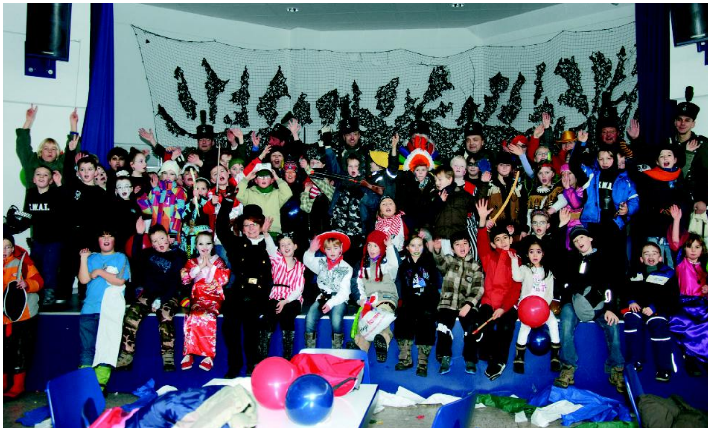
Rathausstürmung durch die Grundschule

Am Samstag, dem 09.02.2013 fand für Kinder- und Senioren ein bunter Nachmittag mit karnevalistischem Programm statt. Veranstalter waren die Gemeinde Wo hratal und die Volkshochschule des Landkreises Marburg-Biedenkopf. Bereits seit einigen Jahren richtet die Gemeinde mit der Volkshochschule einen Seniorenkarneval in den sogenannten "Senioren-Treffpunkten" aus. Nach dem Motto "Jung und Alt gemeinsam" fand die Veranstaltung erstmalig zusammen mit Kindern aus unserer Gemeinde statt. "Jung und Alt gemeinsam" soll dabei ein Miteinander schaffen, einen Einstieg für ein Zusammenspiel der Generationen bieten. "Jung und Alt gemeinsam" so heißt denn auch ein ehrenamtliches Projekt der Gemeinde, in dem z.B. Hilfsdienste für Senioren angeboten werden. Dazu gehören auch Lesenachmittage in den Wo hrataler Kindertagesstätten. Die Gemeinde Wo hratal bedankt sich bei allen, die geholfen haben, den gelungenen Kinder- und Seniorennachmittag in dieser Form auszurichten.