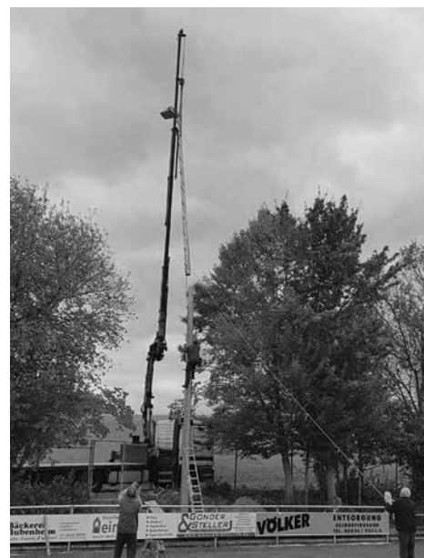
Mit der Unterstützung eines Kranes einer Wohrataler Holzbaufirma wurden die Masten aufgestellt.