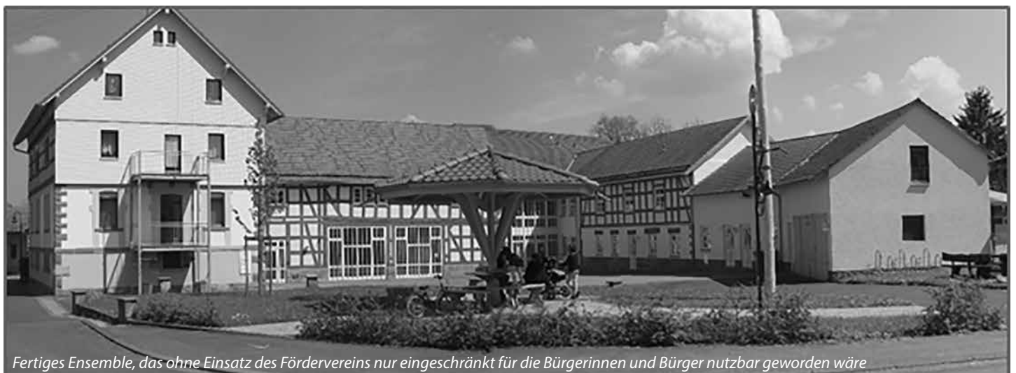
Fertiges Ensemble, das ohne Einsatz des Fördervereins nur eingeschränkt für die Bürgerinnen und Bürger nutzbar geworden wäre