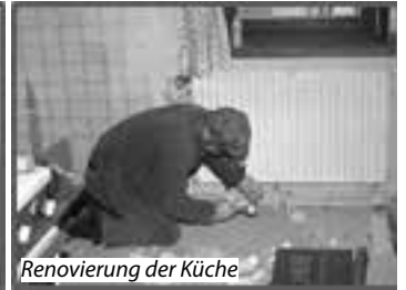
Renovierung der Küche