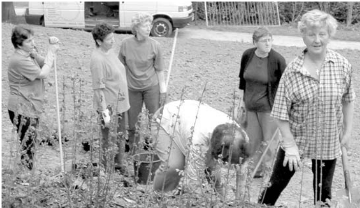
Das Foto zeigt einen Teil der vielen fleißigen Helfer, die Ende April im Einsatz waren, als es darum ging, einen Teilbereich des Friedhofes in Halsdorf neu zu bepflanzen.

Wir möchten uns daher heute für das ehrenamtliche Engagement der Bürgerinnen und Bürger aus Langendorf und Hertingshausen sowie den bisherigen Einsatz der Halsdorfer Bevölkerung sehr herzlich bedanken und gleichzeitig alle ehrenamtlichen Helfer, die bisher freiwillige und kostenlose Arbeiten auf dem Friedhof Halsdorf verrichtet haben, bit-