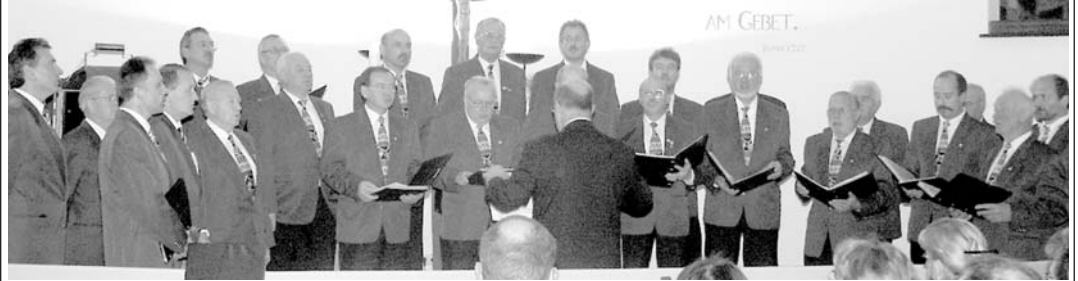
Der MGV Langendorf feiert in diesem Jahr sein 80-jähriges Bestehen

Alle Bürgerinnen und Bürger sind herzlich zu dieser Veranstaltung eingeladen.